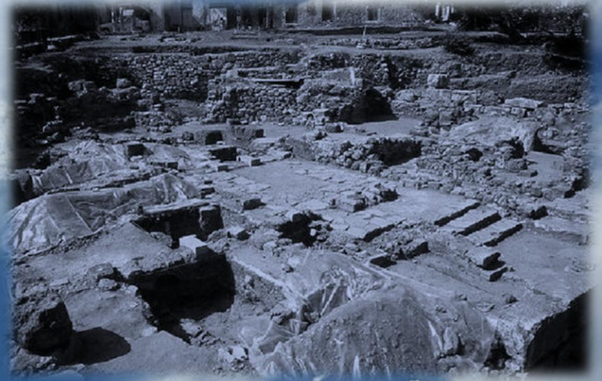
Rovine della città di Cidonia