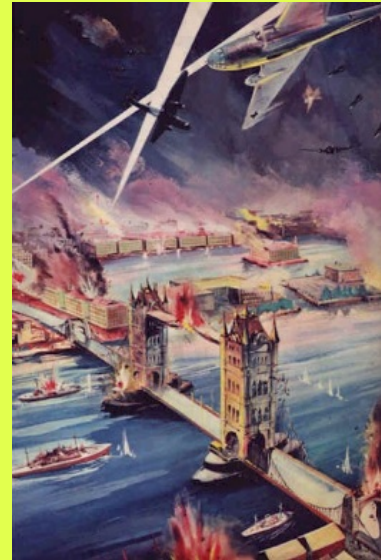
la battaglia d'Inghilterra