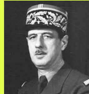
Churchill e De Gaulle