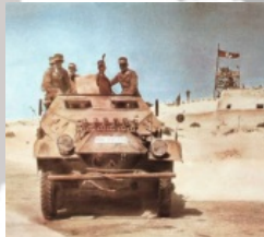
Italia e Germania contro USA e Gran Bretagna