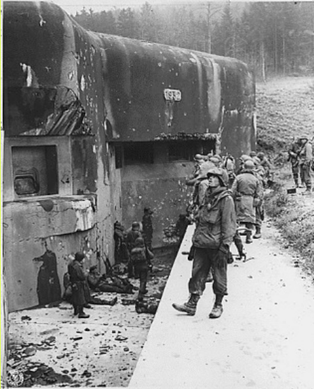
la linea Maginot