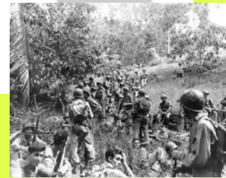
USA contro Giappone