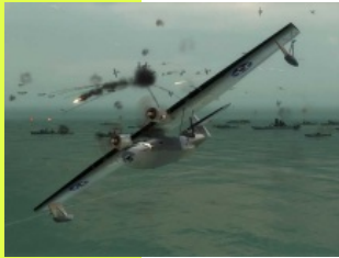
USA contro Giappone