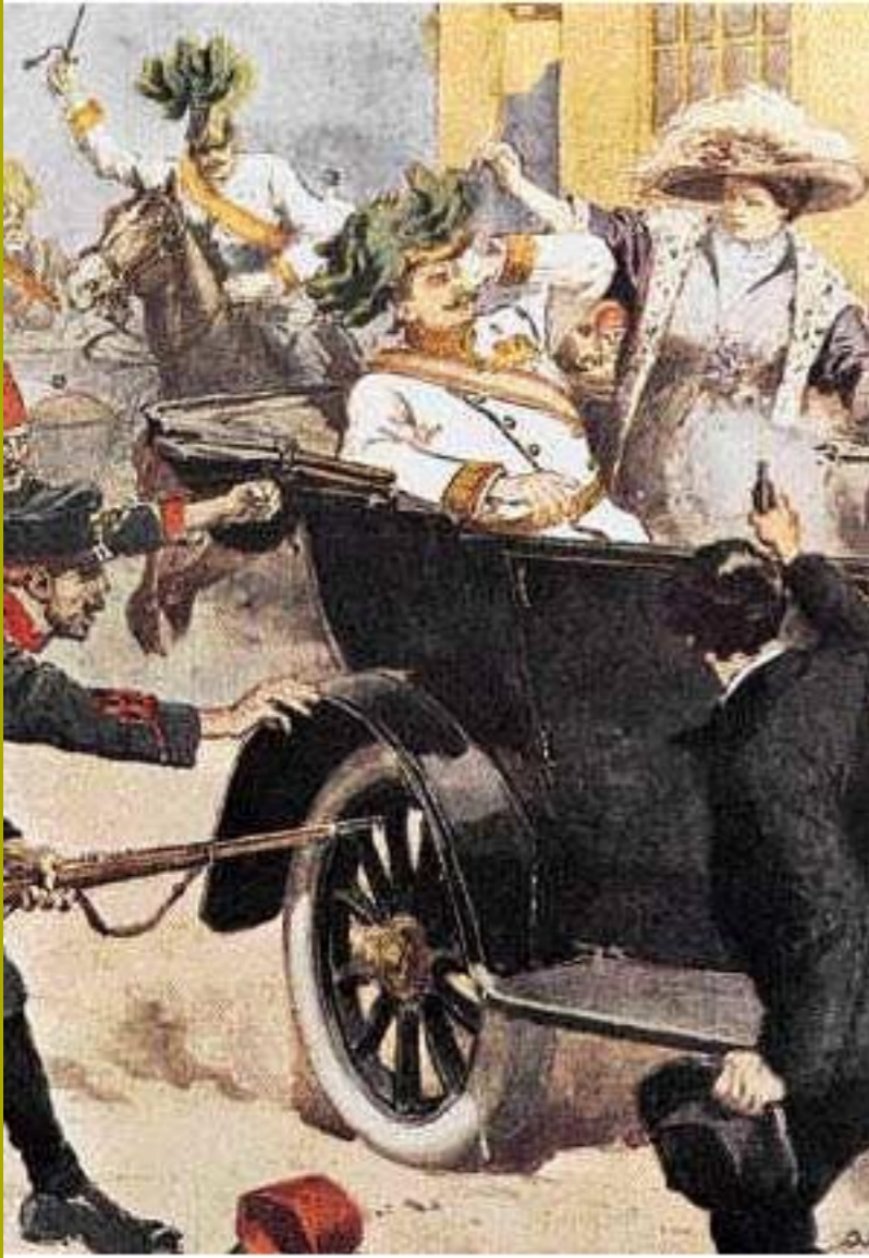
l'attentato a Francesco Ferdinando